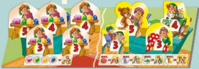
5 Edelstein-Medaillen & 4 Spielsachen-Medaillen

Steckt die Medaillen jeweils in die passenden Standfüße. Danach stellt ihr die Edelstein-Medaillen auf die linke Seite und die Spielsachen-Medaillen auf die rechte Seite des Medaillenplans.